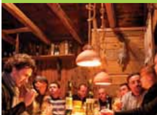
Фото: Денис Перчич