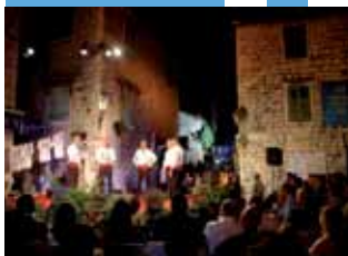
Фото: Владо Зеमुник

Летом Омиш предлагает богатую культурную программу: концерты и сольные концерты в церквях Омиша и в францисканском монастыре, пьесы на городских площадях, различные выставки, литературные вечера и народные празднества. А также предлагается широкая палитра интересных развлекательных программ, таких как Пиратские вечера , Необыкновенные прыжки , плавательный марафон , карнавал и Международный праздник труда . Но самая любимая из них - Фестиваль далматинского пения а-капелла . Смотри вокальных групп в Омише известен всему Адриатическому побережью, а его победители успешно строят свою карьеру в Хорватии и за рубежом. Если Вы желаете посмотреть и послушать лучшие песни а-капелла, фестиваль в Омише - место для Вас.