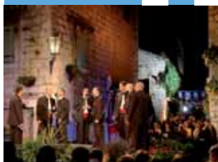
Фото: Владо Зеमुник

Далматинская песня а-капелла в последние годы переживает настоящее возрождение. Благодаря многочисленным фестивалям подлинной далматинской музыки, ее популярность разлетелась далеко за границы Далмации. Одно из мероприятий, заслуженных за это - Фестиваль далматинского пения а-капелла в Омише, который уже тридцать лет развивает традиционное для нашего побережья и островов звучание. Каждый год в Омише собираются лучшие вокальные группы с целью сохранения и развития далматинской песни, а также для того, чтобы сделать их более современными, так как песня а-капелла привлекает многих молодых талантливых музыкантов, которые вносят в нее свежую юношескую энергию.