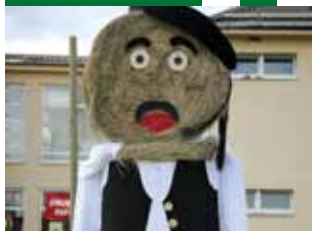
Фото: Марио Роमुлич

Красота холмов региона Лика заставит нас забыть о том, откуда мы и куда идем, а сказочная атмосфера унесет нас в другие времена. Такое же впечатление может произвести и мероприятие Осень в Лике , которое проводится в городе Госпич. Его основное событие - это выставка, где посетители могут познакомиться с возможностями малых хозяйств и предпринимателей региона Лика. Но выставка также показывает и традиционные характеристики этого края: продукты питания, потребительские и декоративные изделия, которые жители Лики изготавливают с давних времен. Выставку сопровождают фольклорные ансамбли песни и танца, своей музыкой создающие подлинное настроение Лики.