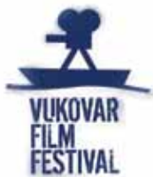
Архив: Вуковар фильм фестиваль

Река фильмов приходит опять! Река Дунай символически связывает все страны, через которые протекает или на которые из-за своей близости влияет. Таким образом, и Кинофестиваль Вуковар фильм фестиваль становится влиятельной демонстрацией одной из самых плодотворных кинематографий в мире - фильмов придунайских стран. Показы фильмов на берегу реки, на так называемой дунайской барже, или в доме лауреата Нобелевской премии Ружичко, гостеприимство хозяев в приятной атмосфере и предложение местных гурманских деликатесов, приглашают Вас на вечеринки и говорят, что Вуковар и Дунай имеют именно то, что нельзя описать словами. Это можно только испытать.