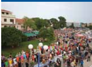
Архив: ТО города Биоград-на-мору

Стол, длина которого шестьсот метров? Это звучит немного нереально, но в Биограде-на-море такой стол действительно существует. Ставят его уже по традиции, а что может оказаться на нем, трудно представить. Во-первых, еды и напитков столько, сколько представить себе невозможно, и это автохтонная продукция, приготовленная по оригинальному рецепту, которую посетителям готовят повара Задарской области; во-вторых, сувениры, собранные со всей Хорватии, а также и соседних стран, таких как Словения, Венгрия и Италия. Всего 232 участника выставки вместе за одним столом! Картина, которую нельзя пропустить!